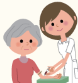
■ 表1：血液検査の目的と検査項目

皆さんの多くは、病院や健康診断で採血を受けたことがあると思います。痛い針を皮膚に挿して血液を採る、あの採血です。採血については、それを受ける側として余り得意ではない方、本当は嫌で受けたくないという方が大勢いらっしゃると思いますが、健康診断のみならず、医療全般につき、採血＝血液検査はかなめの検査法です。病気の原因を調べる、病気を診断する、病気の進行度合いを調べる、治療効果を確認するなどの目的があります。また健康診断では、病気の早期発見のきっかけになることもあります。